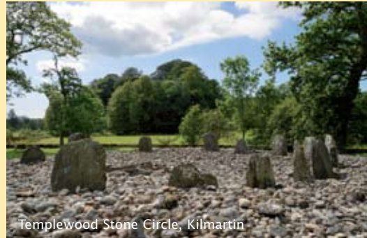
Templewood Stone Circle, Kilmartin

Zo leert u Schotland in al zijn facetten kennen: de ruimte, de rust, de stilte, prachtige vergezichten, steile kliffen, verlaten baaien, onstuimige watervallen, lieflijke meren, heidevelden, maar ook de geschiedenis, de geologie en de planten en dieren.