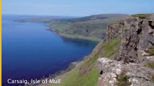
Carsaig, Isle of Mull