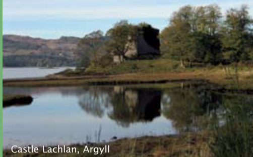
Castle Lachlan, Argyll