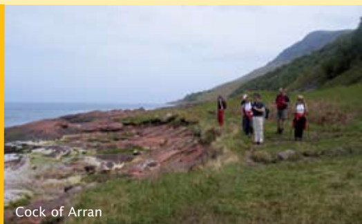
Cock of Arran

Prijs: €960,-; met reis Nederland - Glasgow v.v. (trein of vliegtuig): €1242,50.