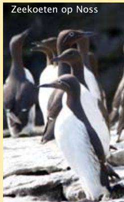
Zeekoeten op Noss