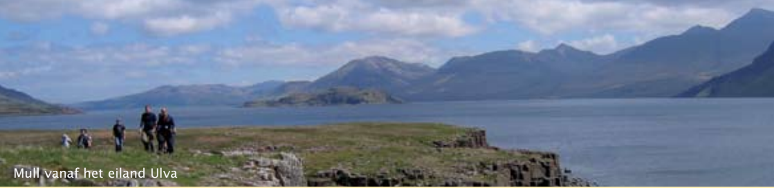
Mull vanaf het eiland Ulva