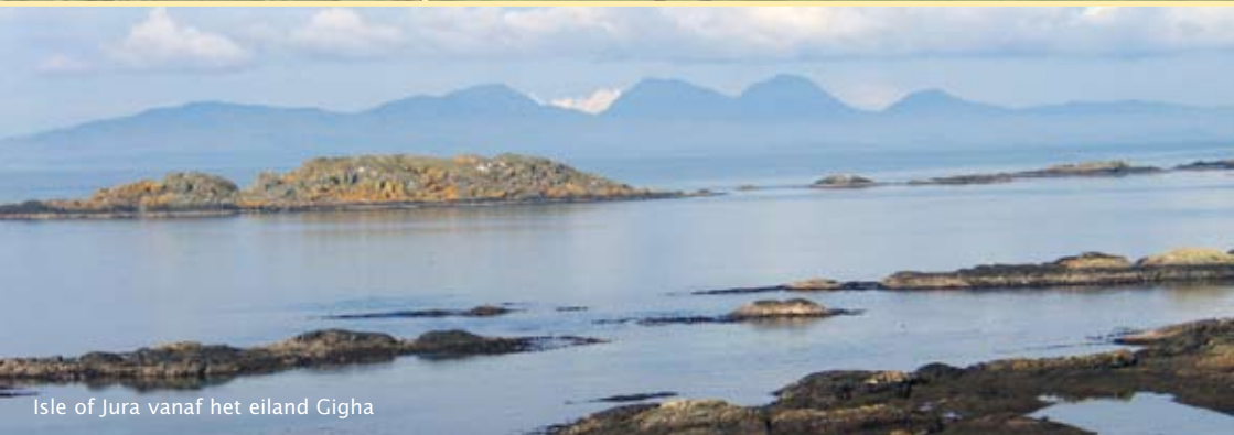
Isle of Jura vanaf het eiland Gigha