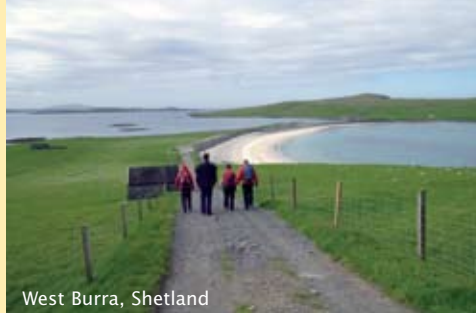
West Burra, Shetland

Prijs: €1050,- ; met reis Nederland - Glasgow v.v. (trein of vliegtuig): €1332,50.