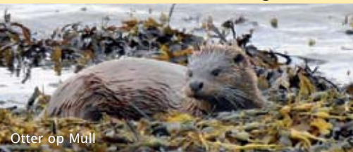
Otter op Mull