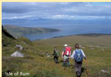
Isle of Rum

Prijs: €920,- (ontbijt, lunchpakket en diner), met reis Nederland - Glasgow v.v.: trein €1202,50; vliegtuig €1302,50.