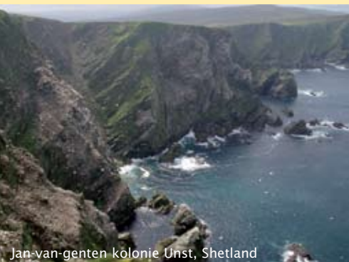
Jan-van-genten kolonie Unst, Shetland