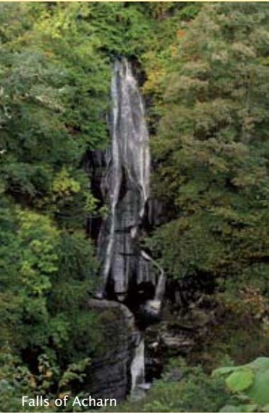
Falls of Acharn