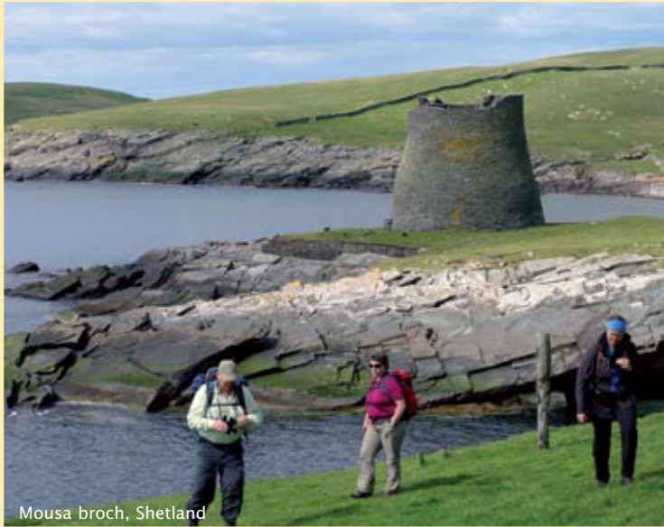
Mousa broch, Shetland