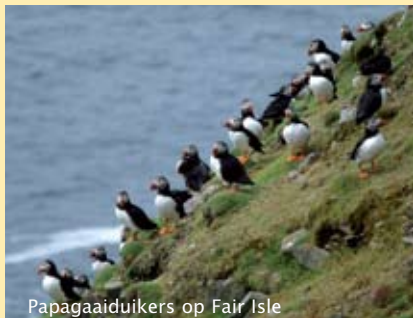
Papagaaiduikers op Fair Isle

Wilt u met een groep vrienden in Schotland gaan wandelen of in andere delen in Schotland dan in ons programma vermeld, laat het ons weten. Wij kunnen dan een voorstel op maat voor u maken.