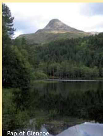
Pap of Glencoe