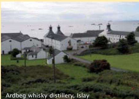
Ardbeg whisky distillery, Islay