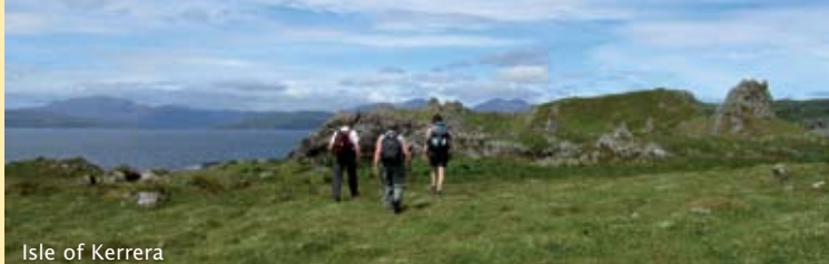
Isle of Kerrera